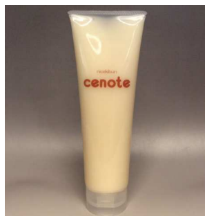
250 g ¥3,240