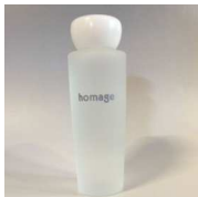
人型ヒアルロン酸 オマーージュ